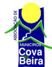
Associação de Municípios da Cova da Beira

Rua dos Combatentes da Grande Guerra nº 62—1º 6200—076 Covilhã —Portugal Telef. + 351 275 323 116 Fax. + 351 327 424 www.amcb.pt amcb@amcb.pt