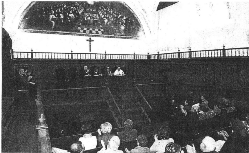
Un reciente acto académico en el Aula Magna de la Upsa, donde hoy comienza el congreso.