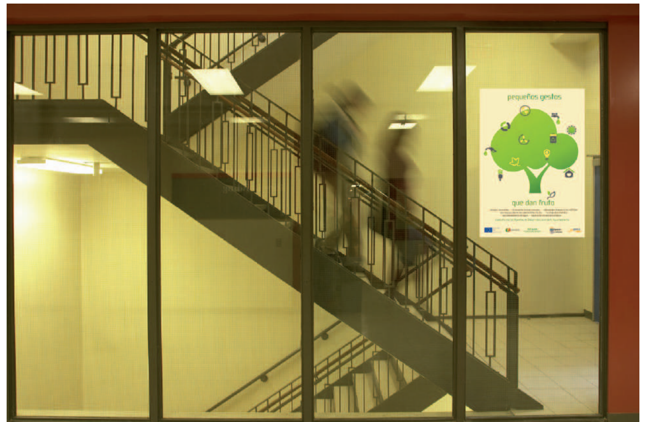
ficticio de colocación de cartel

Es una acción de la Diputación Provincial de Salamanca a través del proyecto RETALER con la ayuda del "Fondo Europeo de Desarrollo Regional".