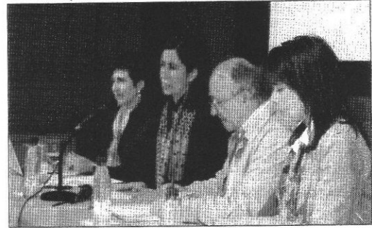
Imagen de unas jornadas sobre el ámbito ibérico

En especial señalan que esta forma de actuar, que supone "un incumplimiento por parte de Iglesias de la legislación vigente", señala "una vez más" la opacidad en materia de contratación.