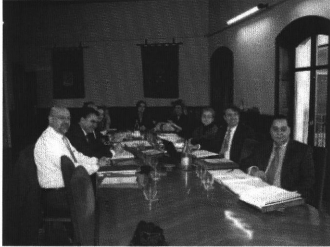
Reunión de la Red Ibérica en la Diputación de Salamanca

El secretario general de la RIET considera que para el Gobierno español la cumbre con Portugal “es de segundo nivel” pese a la relevancia de las cuestiones que hay pendientes entre ambos países. La Diputación de Salamanca tiene propuesto para su aprobación un proyecto para crear un Observatorio de Frontera.