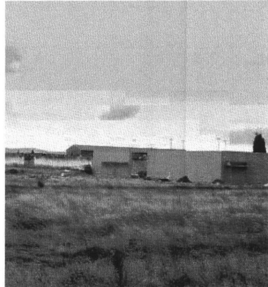
Ubicación de la planta termosolar en la localidad de Sancti Spiritus.

La futura central se ubica a un kilómetro del municipio, y ocupará una superficie de campo solar de 924.865 metros cuadrados con 1.390 colectores, una central de generación de vapor de 50 MWe de capacidad así como un sistema de combustión de biomasa y un sistema de almacenamiento térmico. La superficie total que se ocupará junto con la obra civil necesaria será de 435 hectáreas.