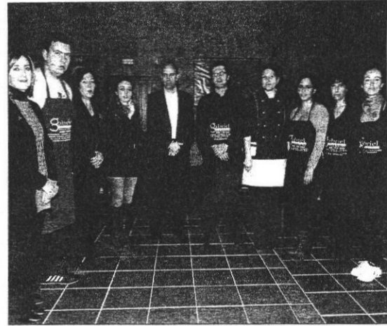
Imagen de los participantes en el curso, junto al alcalde de la ciudad

Este curso es el primer paso de la Escuela Internacional de Cocina y Cata que el albergue quiere poner en marcha. El objetivo es que sea un centro de investigación y formación, con una doble vertiente: la especialización en cocina, y el desarrollo de