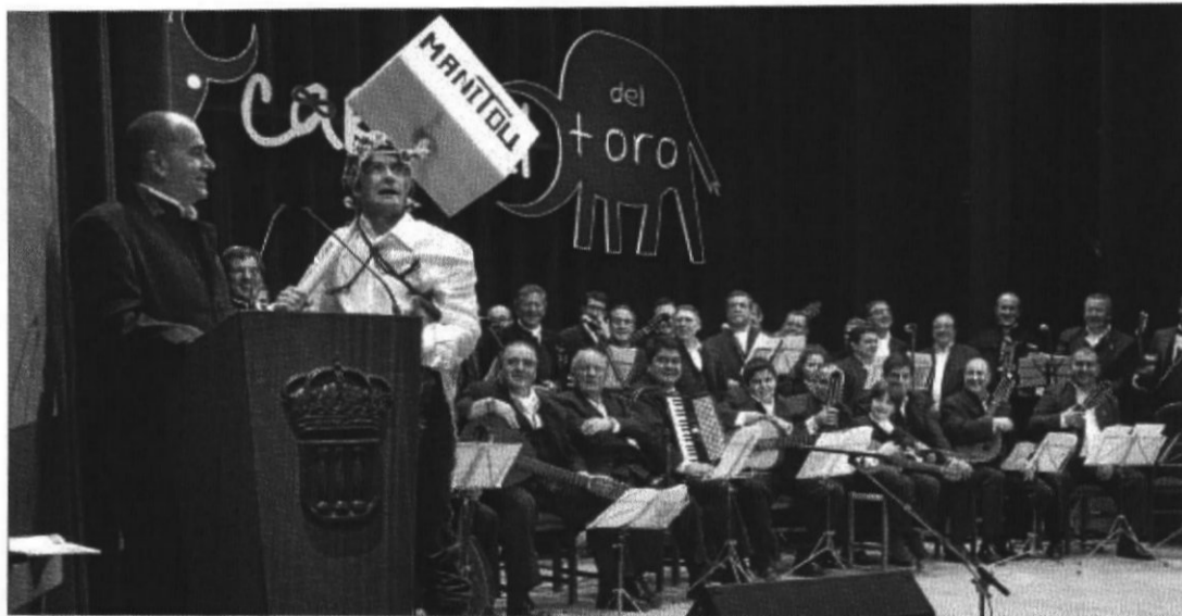
Los miembros de la murga Las III Columnas durante su actuación anoche en el Teatro Nuevo Fernando Arrabal, en la primera de las tres sesiones previstas.