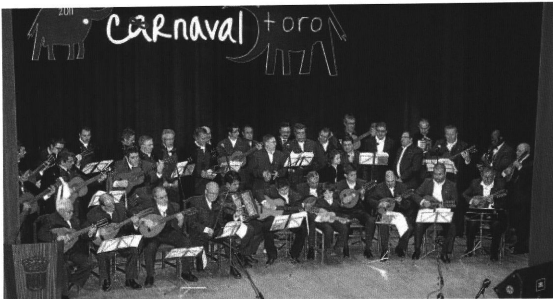
La Rondalla "Tres Columnas", anoche durante la presentación de las coplas del Carnaval del Toro de 2011 en el escenario del Teatro Nuevo.