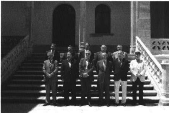
► Presidentes de las Cámaras Municipales de la Beira Interior Norte y de la Diputación de Salamanca

Escrito por: L.F. Miercoles, 30 de Mayo de 2012 14:13