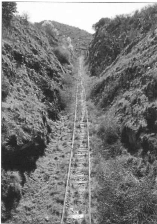
La línea férrea de La Fregeneda en la provincia de Salamanca.

En el documento aprobado, que será remitido a los ejecutivos de ambos países para su inclusión