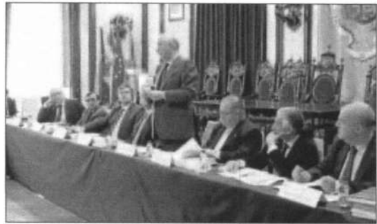
La reunión de la RIET ayer en Coimbra, con el alcalde de Ledesma.

ción, de una vez por todas, de un sistema interoperable. Además, la RIET pide que Guardia Civil y GNR se coordinen en materia de tráfico, compartiendo datos sobre normativa para evitar sanciones innecesarias y un convenio marco que contemple el transporte de proximidad. ■