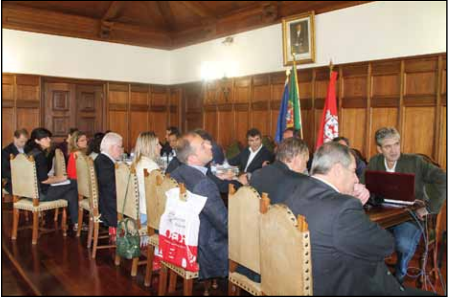
Presentación de la Estrategia BIN-SAL 2020 a los miembros de la CT BIN-SAL en el Salón Noble de la Cámara Municipal de Figueira de Castelo Rodrigo, 13 de junio de 2013