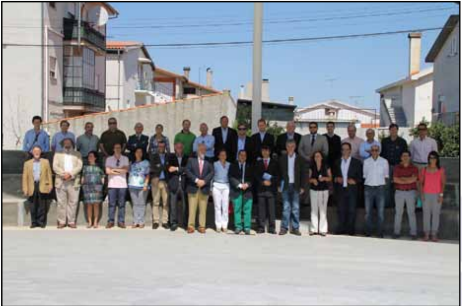
Miembros de la CT BIN-SAL y entidades colaboradoras del Centro de Análisis y Prospectiva Territorial.

Esta doble tipología de inclusión se encuentra en línea con las directrices comunitarias en materia de estimulación de los partenariados público-privados para el desarrollo de actuaciones en el marco de los programas con financiación comunitaria. La implicación del tejido empresarial se antoja imprescindible, así como la configuración de un partenariado suficientemente representativo que incluya, en lo posible, a los principales actores del territorio.