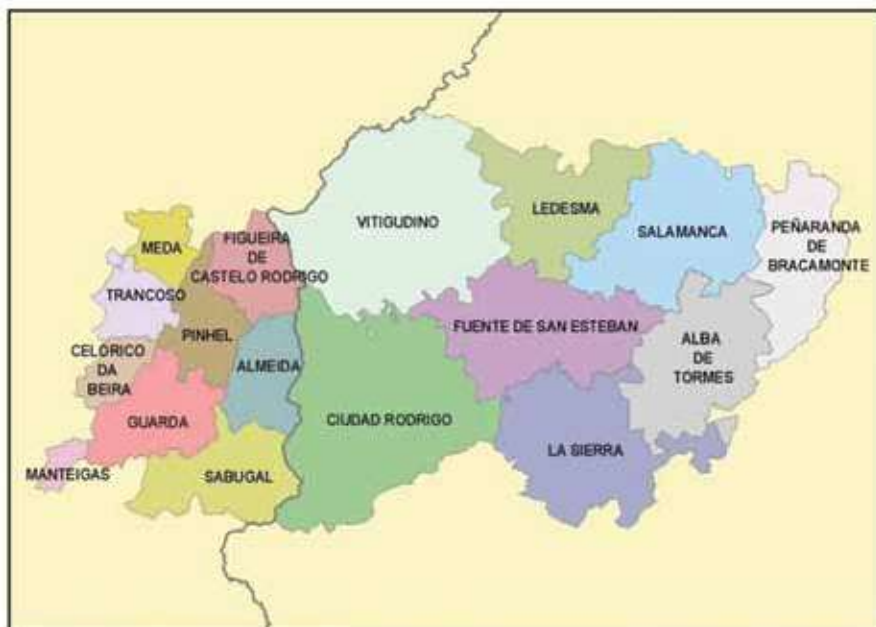
Esquema de situación