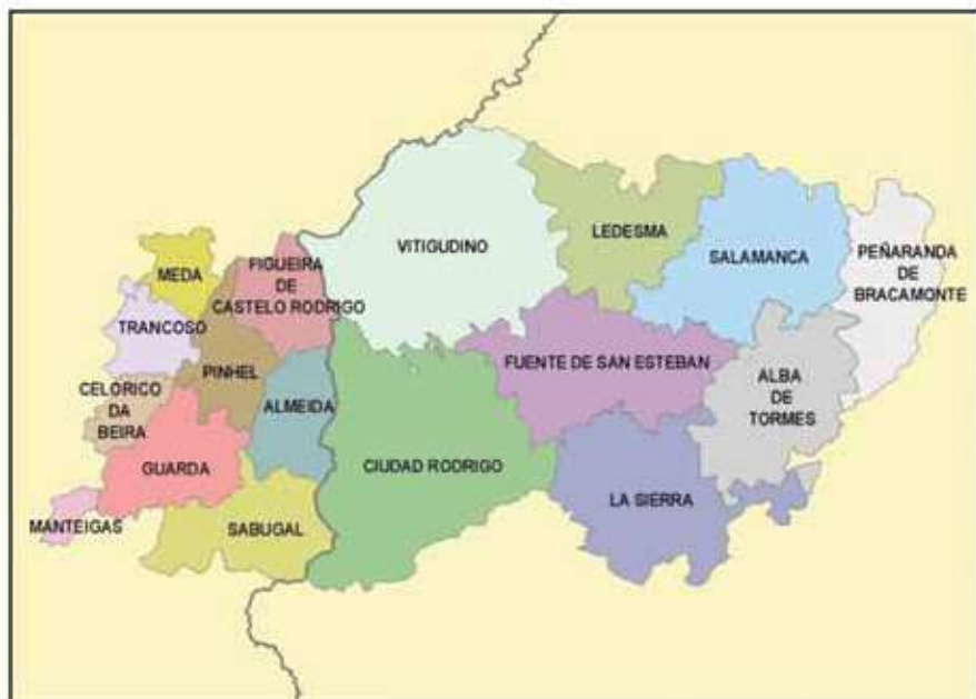
Esquema de situação